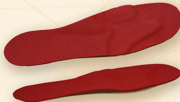
Aktiveinlage für Sport-, Wander- und Arbeitsschuhe

Podologische Aktiveinlagen sind nur wenige Millimeter hoch und werden sowohl in Alltagsschuhen als auch in Sportschuhen getragen.